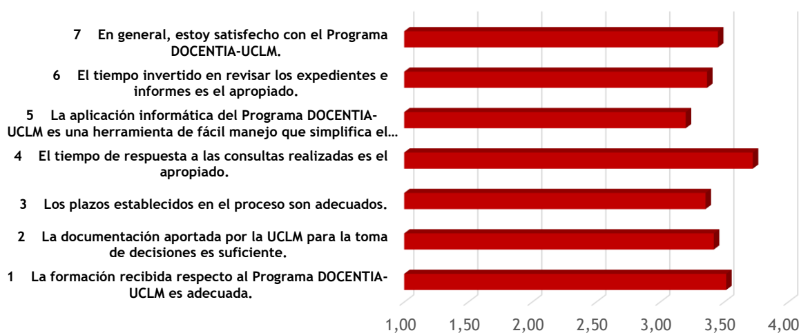
Figura 2. Resultados de satisfacción de las personas evaluadoras y miembros de la Comisión y Subcomisiones DOCENTIA-UCLM convocatoria 2023.

Las encuestas de satisfacción para el conjunto de todos los evaluadores y los integrantes de la Comisión y Subcomisiones DOCENTIA-UCLM fueron recogidas el 05/02/2024. La tasa de respuesta fue del 51,67% (31 respuestas obtenidas de una población de 60 personas). En la Figura 2 aparecen los resultados de satisfacción para cada uno de los ítems de la encuesta.