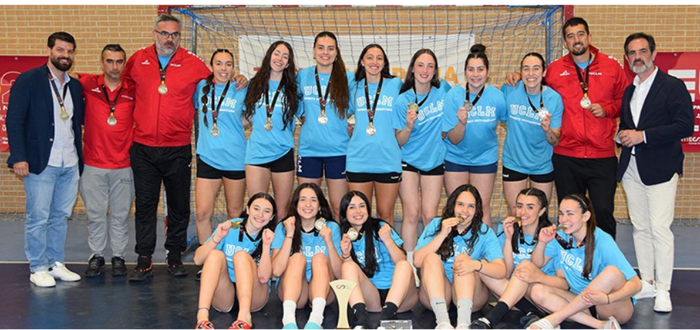
Balonmano Femenino. Equipo