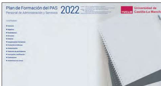
Foto GER.1. Pdf interactivo Plan de Formación PAS 2022

Se está diseñando el nuevo Plan Director de Gestión que será eminentemente colaborativo , con una doble vertiente: