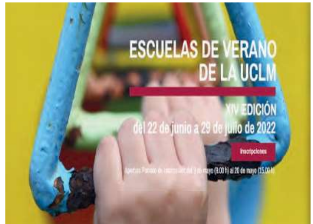
Foto GER.2. Escuelas de Verano de la UCLM 2022

En este curso académico se ha realizado con completa normalidad el servicio de Escuelas de Verano para los hijos e hijas del personal de la UCLM , teniendo una gran acogida, distribuida en tres turnos desde el día 22 de junio hasta el 29 de julio [Imagen GER.2]. Con las adaptaciones necesarias a la situación sanitaria actual, se han podido ofertar hasta 140/150 plazas por turno y campus, acogiendo a más de 500 niños y niñas en sus diferentes turnos.