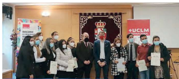
Foto VI.5. Clausura estudiantes Study Abroad Universidad Ibagué (Colombia) en el campus de Cuenca curso 2021-2022

Otra señal de la activación de la movilidad internacional de la UCLM ha sido la recuperación de los Study Abroad . Bajo esta modalidad, la Universidad de Castilla-La Mancha ofrece programas internacionales adaptados para aquellos estudiantes y profesores no nativos que deciden realizar estancias de corta duración en nuestra Universidad, proporcionándoles la oportunidad de participar en cursos, seminarios y conferencias. Con una doble orientación, estos cursos abordan desde un punto de vista académico diferentes disciplinas de conocimiento, así como la po-