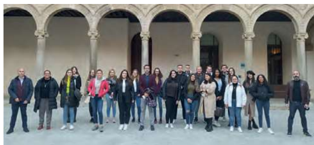
Foto VI.6. Inauguración Study Abroad Universidad de Furtwangen (Alemania) en el campus de Toledo curso 2021-2022

sibilidad de complementarlo con cursos intensivos de lengua española. La formación académica suele incluir actividades de contenido cultural que permiten al asistente una mayor inmersión en nuestro país. Durante el curso 2021-2022 la UCLM ha acogido los tres siguientes: