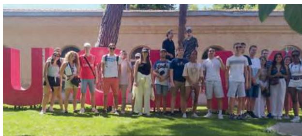
Foto VI.7. Visita al campus de Toledo grupo Study Abroad ESTP Paris curso 2021-2022

El proyecto de Universidades Europeas surge en el año 2018 con el objetivo de fomentar la creación de más de 20 «Universidades Europeas» para el año 2024, consistentes en redes de universidades creadas desde abajo en toda la UE que permitan a los estudiantes obtener un título al combinar estudios en varios países de la UE y contribuir así a la competitividad internacional de las universidades europeas. A fecha de elaboración de esta memoria, la Comisión Europea aún no ha publicado la resolución de esta convocatoria, estando prevista para finales del mes de julio 2022.