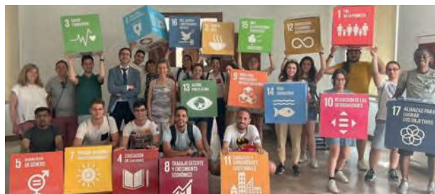
Foto VI.1. Participantes Programa Intensivo Combinado en el campus de Toledo

Los programas de movilidad son uno de los instrumentos fundamentales a través de los cuales la UCLM lleva a cabo su estrategia de internacionalización, mediante el envío y la recepción de participantes de la comunidad universitaria con el fin de realizar estudios, prácticas, investigación, docencia, formación e intercambio de buenas prácticas. Las estancias de los participantes entran-