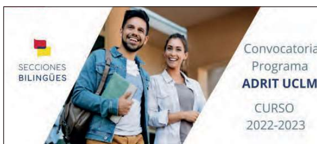
Foto VI.8. Imagen convocatoria Programa ADRI-UCLM

Gracias a la colaboración de los Vicerrectorados de Internacionalización y de Innovación, Empleo y Emprendimiento, junto a la Escuela Superior de Ingeniería Informática de Albacete, la Facultad de Ciencias del Deporte de Toledo y la Facultad de Ciencias Sociales de Talavera de la Reina, la UCLM ha conseguido el Proyecto Capacity Building – EIT-KIC Action , financiado por el Instituto Europeo de Innovación y Tecnología (EIT). En el proyecto titulado Entrepreneurial Preparation for Notable and Engaging Universities (ENTREPRENEUR) participan las siguientes instituciones: Uniwersytet Slaski w Katowicach (Polonia); Vytauto Didžioji Universitetas (Lituania); Mälardalen University (Suecia); Vrije Universiteit Brussel (Bélgica); UCLM (España); GrantXpert (Grecia); y Teaching Factory Competence Center Astiki Mi Kerdoskopiki Etaireia (Chipre).