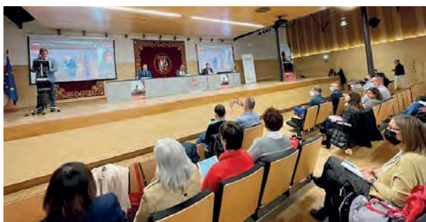
Foto VI.14. Inauguración Jornada «Academias de Profesores Erasmus+»