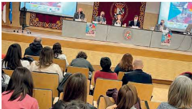
Foto VI.12. Inauguración Jornada de Plurilingüismo