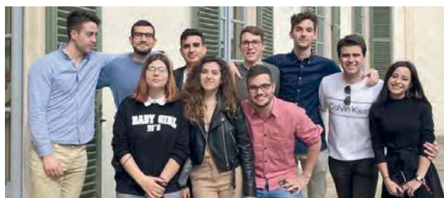
Foto VI.2. Participantes Programa Intensivo Combinado en Pavia (Italia)

tes se desarrollan en los diferentes campus de la UCLM, y las estancias de los participantes salientes tienen lugar en las sedes de las diferentes instituciones socias o empresas asociadas de las diferentes partes del mundo.