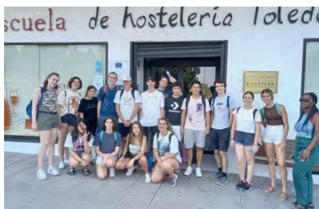
Foto VI.9 y 10 Actividades desarrolladas por participantes del programa Refresca tu Inglés en la UCLM

versitarios castellanomanchegos en su progreso y mejora de las competencias idiomáticas del inglés, propiciando de este modo un exitoso camino en su futura educación superior [Fotos VI. 9 y 10]. Durante el desarrollo del programa los estudiantes han tenido la posibilidad de mejorar sus destrezas idiomáticas con estudiantes nativos que se encuentran en la UCLM realizando los cursos de los Programas de Español para Extranjeros en Cuenca (ESPACU) y en Toledo (ESTO).