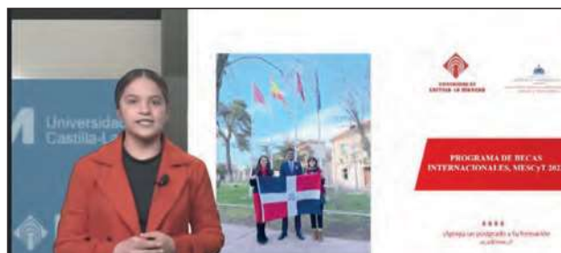
Foto VI.3. Imagen de video promocional grabado por estudiante dominicana becada por el convenio MESCYT - UCLM

Asimismo, un grupo de diez estudiantes de la Facultad de Ciencias Económicas y Empresariales de Albacete [Foto VI.2] ha participado en el seminario SEPPI – Sustainable Europe, Policy Proposals & Indicators - junto con estudiantes de las universidades de Pavia (Italia), Gante (Bélgica) y la Bochum Hochschule (Alemania). El seminario tuvo en Pavia entre el 20 y el 24 de abril, y ha formado parte de un programa BIP organizado por la institución italiana.