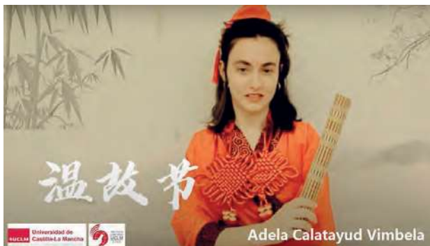
Foto VI.11. Cursos Instituto Confucio