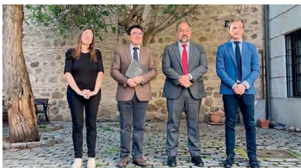
Foto VI.13. Inauguración congresos Alfonso X en el curso de una tradición