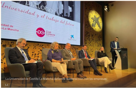
La Universidad de Castilla La Mancha defiende la interacción con las empresas

El foro Diálogo 'La Universidad y el trabajo del futuro', que ha organizado este miércoles en Madrid el Club Conecta, la asociación de periodistas y comunicadores de Castilla-La Mancha en Madrid, ha abogado por un modelo de formación universitaria lo más multidisciplinar y transversal posible para colmar así los perfiles laborales que en la actualidad buscan las empresas.