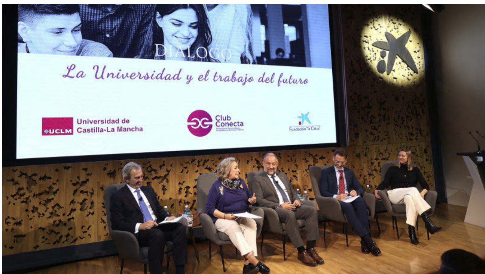
Julián Garde, rector de la UCLM, participó en el Foro Diálogo 'La Universidad y el trabajo del futuro'.

Castilla-La Mancha registró en 2022 un total de 14.511 nacimientos y 20.541 defunciones, con una esperanza de vida que llega a los 80,89 años entre los hombres y 85,83 años para las mujeres. A nivel nacional, el pasado año registró menos nacimientos, menos hijos por mujer, más alumbramientos de mujeres mayores de 40 años, más fallecimientos, una ligera reducción de la esperanza de vida femenina y muchas más bodas que 2021, según revelan los datos publicados ayer por el Instituto Nacional de Estadística (INE).