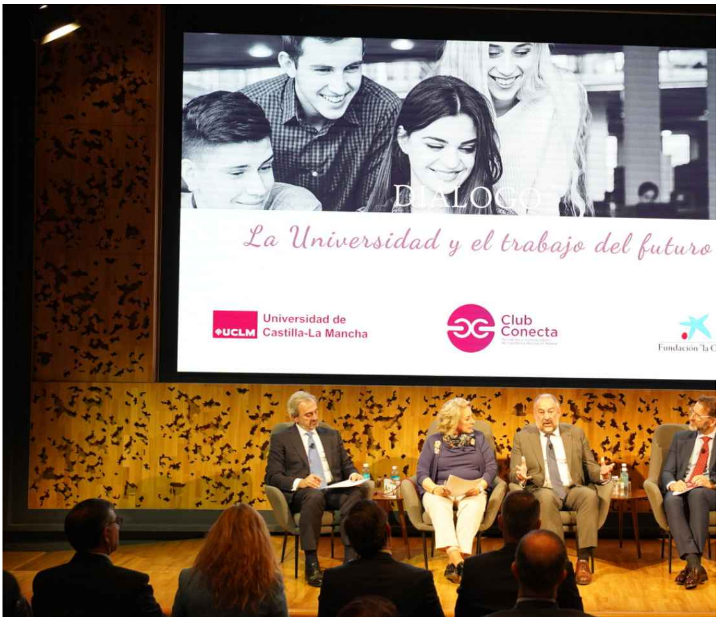
Foro 'Universidad y el trabajo del futuro'.