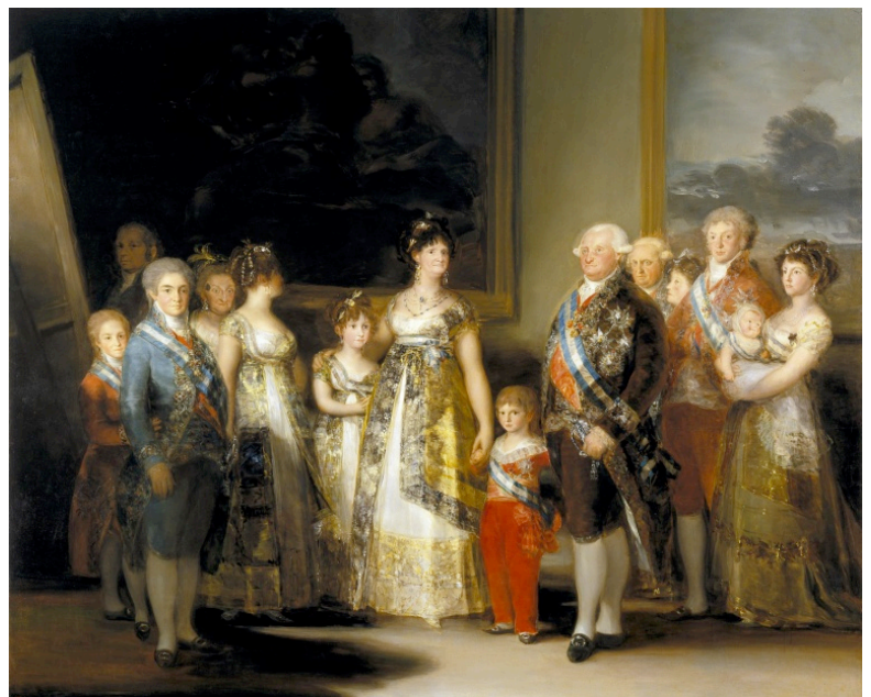
Fig.2 Puntuación máxima. 2 puntos