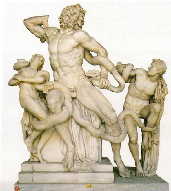
Fig.1 Puntuación máxima. 2 puntos

Analiza y comenta las dos obras de arte presentadas: