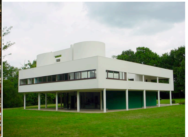
Fig.2 Puntuación máxima. 2 puntos