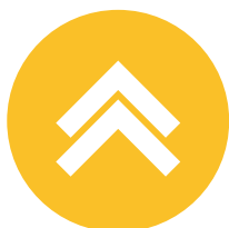
ILUSTRACIÓN DE CUBIERTA: ANTONIO SANTOS